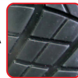
ANTYPOŚLIZGOWA PODESZWA SRC