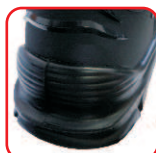
WSPORNIK TPU CHRONIĄCY PIĘTĘ I ŚCIĘGNO ACHILLESA